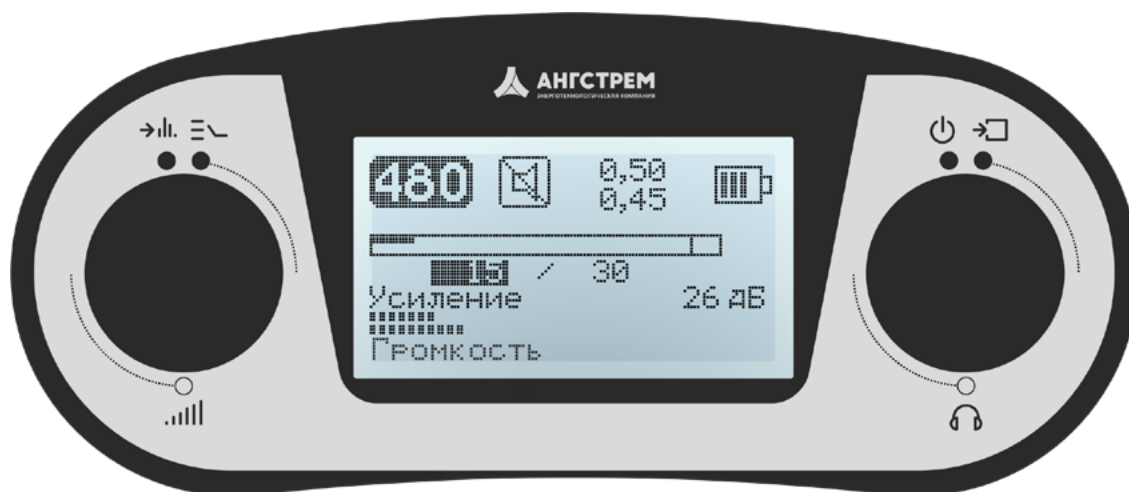
Рис. 1 – Передняя панель приемника ПП-500К

*** – минимальная полоса пропускания в процентах к центральной частоте в режиме Узкая Полоса (УП).